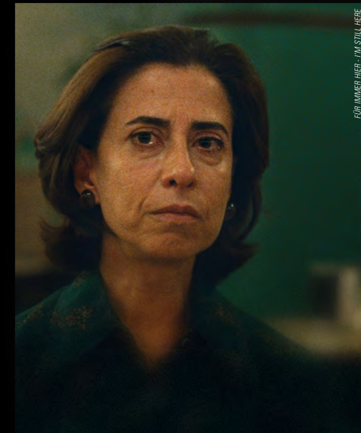
FÜR IMMER HIER - I'M STILL HERE

MÄRZ-APR/MAR-APR '25 STERZING / VIPITENO